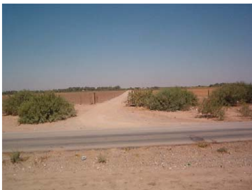
Acceso principal a la P.P. 6 de Mayo desde la carretera