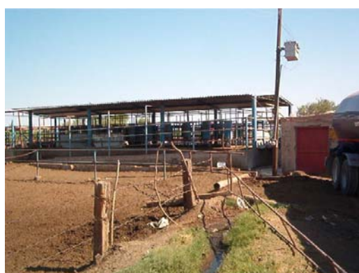
Sala de ordeña en paralelo, con equipo, sombras y área de antesala.