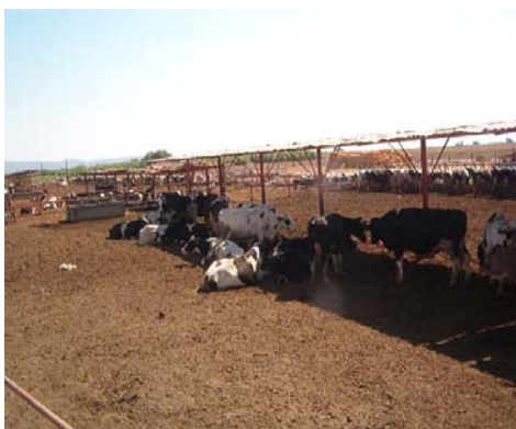
Instalación de Corrales para vacas, con sombras y bebederos