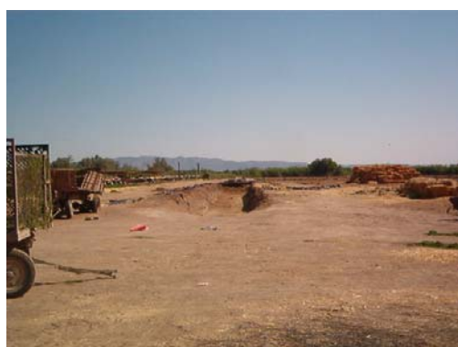
Fosa para ensilaje de forraje, o silo tipo "bunker", sin revestimiento.