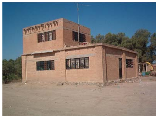
Vista a la construcción de la Casa del Encargado.