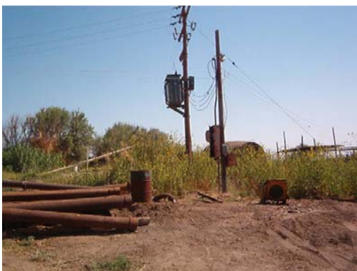
Pozo profundo de uso agrícola, anexo a establo, sin equipo y operación.