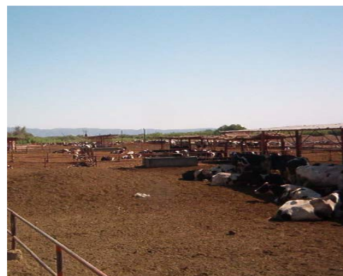
Instalación de Corrales para vacas, con sombras y bebederos