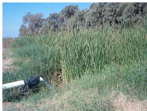
Estanque sin revestir para agua, con descarga del pozo profundo