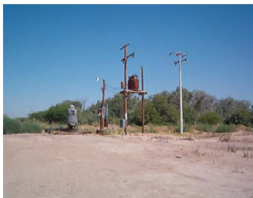
Pozo profundo de uso agrícola con transformador, motor y bomba verticales.