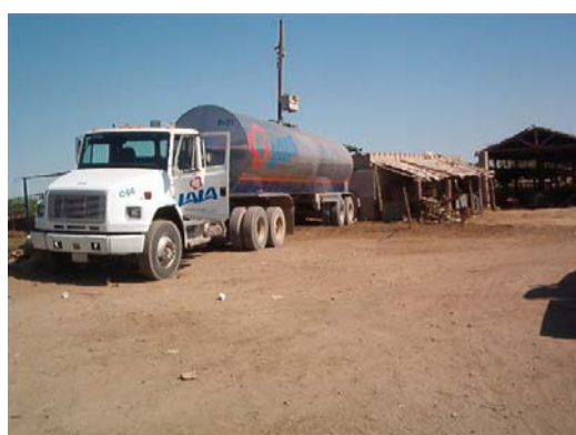
Entrega de leche a comercializadora, desde cuarto para tanques enfriadores.