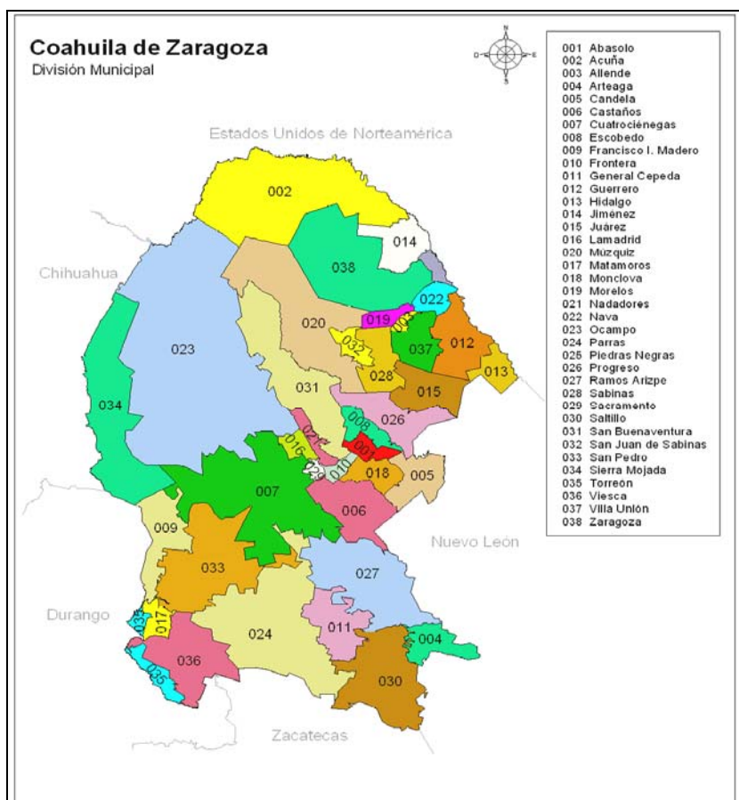
Figura 3.1. Mapa Satelital y General del Estado de Coahuila. Fuentes: Gobierno del Estado de Coahuila, www.coahuila.gob.mx . INEGI, Marco Geoestadístico Municipal 2005.