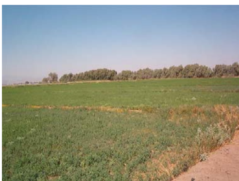
Cultivo de alfalfa en desarrollo posterior a riego, para producir forraje.