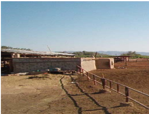
Construcción de Bodega y Oficina – almacén