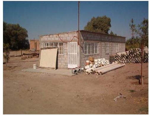
Construcción de Oficina del Propietario