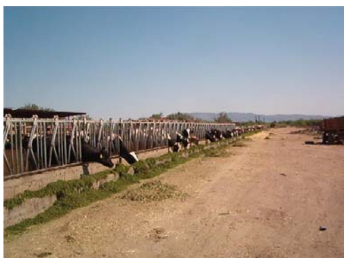
Instalación de corrales para ganado, con trampas y comedero de concreto