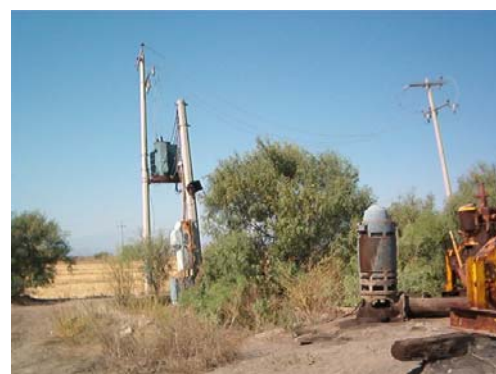
Pozo profundo de uso agrícola con transformador, motor y bomba verticales.