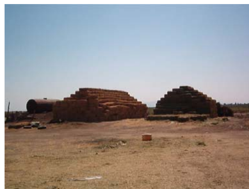
Hacinamiento de forraje henificado y patio de maniobras