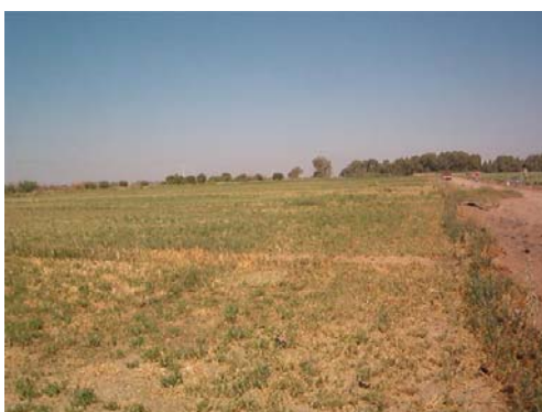
Cultivo de alfalfa después de corte y empaque, con riego en proceso.