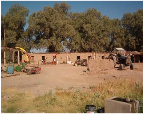
Construcción de cuartos para taller