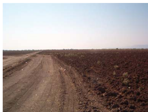
Terreno agrícola laborable o abierto a cultivo, con trabajo de barbecho.