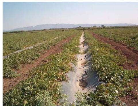
Cultivo de melón sembrado con acolchado plástico agrícola