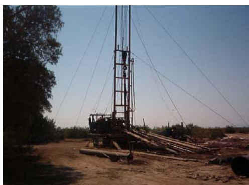
Perforación de pozo profundo para reposición de pozo anexo al establo