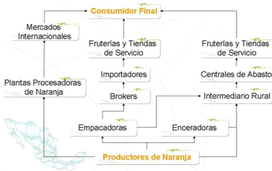
Figura 2. Canal de comercialización de la naranja