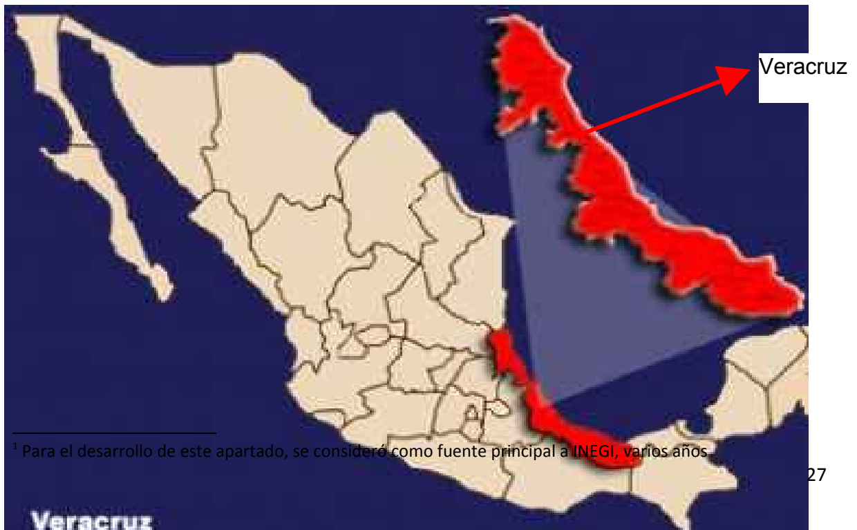
Figura 3. Ubicación del Estado de Veracruz

Veracruz limita al norte con el Estado de Tamaulipas; al sur con Oaxaca y Chiapas; al este con Tabasco y el Golfo de México; y al oeste con los Estados de Puebla, Hidalgo y San Luis Potosí. Su línea costera tiene una extensión de 745.1 km. Su extensión máxima de noroeste a sudeste es de 800 Km. y su máxima de ancho es de 212 Km. mientras que la mínima es de 32 Km. Se divide políticamente en 210 municipios (INEGI, 2009). El clima de Veracruz varía drásticamente. Cuenta con zonas cálidas húmedas y durante todo año los picos de sus montañas están nevados. Sin embargo, la mayoría del territorio se encuentra en la zona tropical, de manera que durante el verano su clima es cálido húmedo y su temperatura anual promedio es de 25°C.