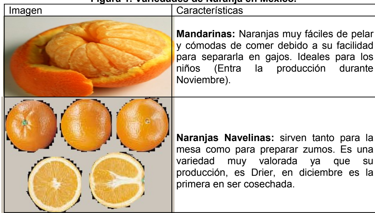
Figura 1. Variedades de Naranja en México.

En México existen algunas variedades de naranja, en la cual las más importantes dentro de la producción nacional es la naranja valencia del grupo blanca. A continuación en el cuadro siguiente se presentan algunas variedades de mayor importancia para México.