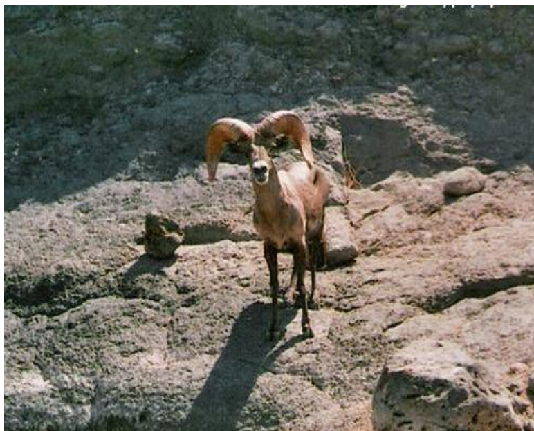
Figura 8. Borrego cimarrón ( Ovis canadensis )

En cuanto a los mamíferos hay 44 especies silvestres. De estas especies destaca el berrendo sonoreño ( Antilocapra americana sonorensis ) que se encuentra en peligro de extinción además de ser una sub-especie de hábitat restringido, el borrego cimarrón ( Ovis canadensis mexicana ) sujeto a protección especial, y los murciélagos magueyero ( Leptonycteris curasoae yerbabuena ) y pescador ( Myotis vivesi ), ambos endémicos, el primero amenazado y el último en peligro de extinción. Cabe destacar que en la NOM-059 de 1994, el venado bura ( Odocoileus hemionus ) y la zorra gris ( Urocyon cinereoargenteus ) se encontraban amenazados y gracias a los esfuerzos de conservación en el sitio, estas especies han sido removidas de dicha lista.