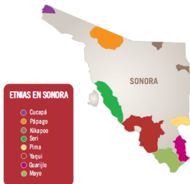
Figura 2. Mapa de ubicación de las Etnias en el Estado de Sonora

Sin embargo, no sólo los admirables paisajes y la gran riqueza biológica hacen del Pinacate un sitio especial, además en sus tierras vivieron durante miles de años grupos humanos que dejaron a su paso infinidad de evidencias consideradas actualmente sitios sagrados y ceremoniales de sus descendientes los O'odham o Pápagos.