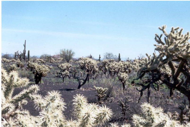
Figura 6. Bosque de Choya ( Opuntia bigelovii )

Se entiende por matorral xerófilo a toda la vegetación que se encuentra en los climas áridos y semiáridos. Dentro de las zonas núcleo encontramos bosques de cholla o “chollal”, donde se forman agrupaciones de plantas crasas representadas por el género Opuntia spp. Teniendo asociaciones con la vegetación circundante, en éste caso con los mezquitales, en donde, como su nombre lo indica, abundan los árboles del género Prosopis spp. , mejor conocidos como mezquites. Por lo general se desarrollan en terrenos con cierto grado de humedad en donde el manto freático no es muy profundo, los suelos por lo general son bajos. En cuanto a la vegetación halófila, y que de alguna manera crece en las dunas de arena, éstas se van fijando de manera progresiva y proviene de las áreas circunvecinas siendo el género Larrea spp. el de mayor distribución, aunque con asociaciones con el género Atriplex spp.