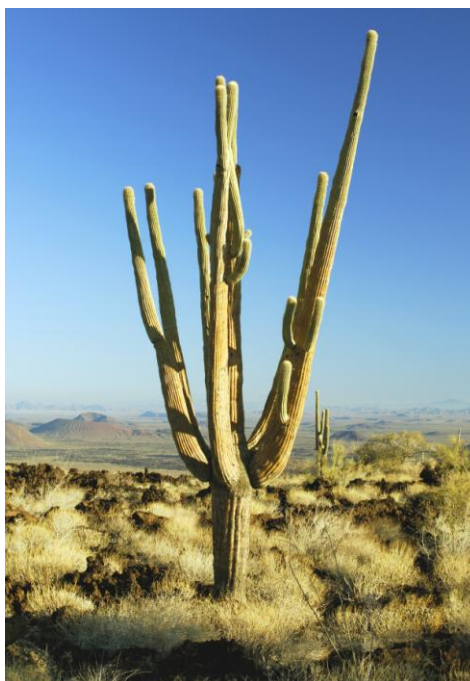
Figura 7. Cacto Sahuaro ( Carnegiea gigantea ) característica del Desierto Sonorense

La presencia de especies de flora endémica o con algún grado de diferenciación taxonómica y con alguna categoría de protección, representan uno más de los valores biológicos y ecológicos más importantes de El Pinacate y Gran Desierto de Altar como área representativa del Desierto Sonorense.