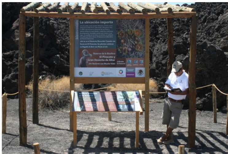
Figura 11. Revisión (monitoreo) de señalización en senderos interpretativos

Así mismo se contabilizaron los grupos de visitantes que hicieron uso de los senderos interpretativos en el Cráter El Elegante durante Semana Santa del periodo 2008 al año 2010.