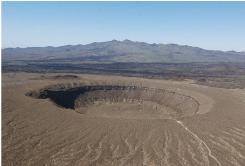
Figura 5. Cráter El Elegante y al fondo la Sierra del Pinacate

De todos los cráteres El Elegante es el más visitado por ser el más accesible. Es el más grande de todos, tiene 250 metros de profundidad y 1,600 metros de diámetro. Este cráter contenía un lago durante el periodo pluvial precedente al último periodo antitérmico. La sección de un cono cinerítico es visible en la curva sureste de la pared del cráter, mientras que en la porción noroeste del fondo hay un bloque de material del borde que cayó hace mucho tiempo. Se pueden observar las tobas del borde sobre lava basáltica. Además, se observa una vereda india usada por los cazadores de borrego cimarrón que rodea completamente el borde del cráter.