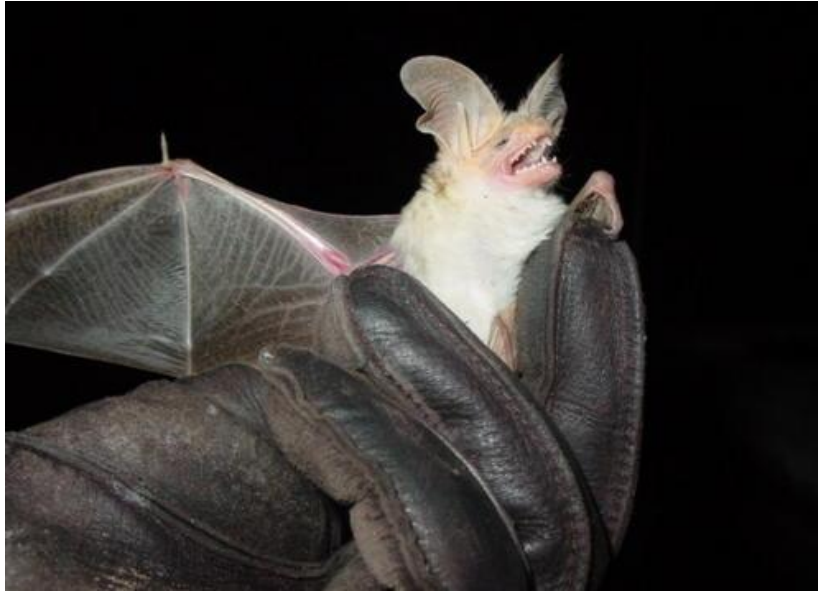
Figura 9. Murciélago magueyero ( Leptonycteris curasoae yerbabuena )