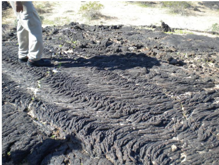
Figura 3. Lava tipo Pahoehoe

culminó con la formación del escudo volcánico de El Pinacate durante el Pleistoceno tardío y gran parte del Holoceno. Este escudo volcánico representa uno de los complejos geológicos más destacables del Gran Desierto de Altar ocupando una superficie aproximada de 2000 km 2 , el cual presenta tres cimas principales: el Pico Pinacate, el Pico Carnegie y el Pico Medio. Al conjunto se le denomina volcán Santa Clara o Sierra Pinacate. Estos tres picos fueron las fuentes de emisión de la mayoría de los derrames de lava más grandes de la región. Los flujos de lava que delimitan el escudo volcánico y que materializan la actividad efusiva en el área se extienden por más de 20 Km. Son coladas de composición basáltica y naturaleza alcalina, generalmente muy vesiculares produciendo en su mayoría lavas de tipo aa (aprox. 95%) y raras lavas tipo pahoehoe y lavas en bloques. El volumen total de lava basáltica emitida se estima entre 150 y 180 km 3 .