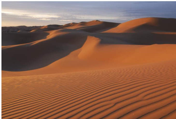
Figura 4. Dunas del Gran Desierto de Altar

En la parte occidental de la Sierra El Pinacate, se encuentra el componente geológico dominante, los campos de dunas. Los campos de dunas del Gran Desierto de Altar forman un mar de arenas activas, también llamado Erg de más de 550, 000 ha. Las dunas que se encuentran en El Pinacate y Gran Desierto de Altar son lineares, crecénticas (transversales) y en estrella. Todas estas pueden ser además simples, compuestas y complejas. Aunque las dunas lineares dominan (aproximadamente 70%), las dunas crecénticas complejas y las dunas de estrella son de mayor importancia por su formación y gran altura.