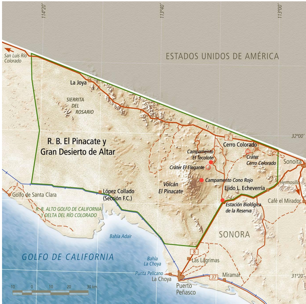
Anexo 1. Mapa general de ubicación de la Reserva de la Biosfera El Pinacate y Gran Desierto de Altar