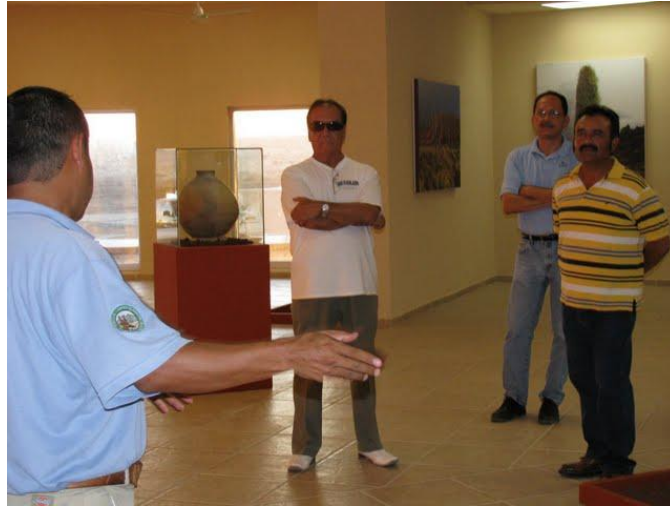
Figura 10. Desarrollo de pláticas a grupos organizados en el Centro de Visitantes

Pláticas y conferencias.- Apoyándonos en eventos masivos durante celebraciones especiales como el inicio de la primavera, la semana nacional por la conservación de CONANP, la semana de ciencia y tecnología de los bachilleres, etc., así mismo se realizaron conferencias programadas con grupos escolares y de organizaciones civiles con temas de interés como fauna silvestre, precauciones en el desierto, prácticas ilegales de aprovechamiento de recursos naturales, energías alternas, etc.