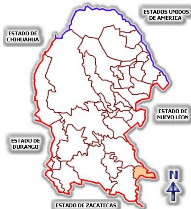
Figura 1. Ubicación Geográfica de Arteaga, Coahuila.

El municipio de Arteaga está conformado por 366 localidades, de las cuales 26 corresponden a ejidos, 8 congregaciones, 13 colonias populares y un gran número de fraccionamientos campestres y pequeñas propiedades, siendo los más importantes la villa de Arteaga, el Tunal, Huachichil, Bella Unión, Los Lirios, Mesa de las Tablas, Jame, Escobedo, San Antonio de las Alazanas y Santa Rita.