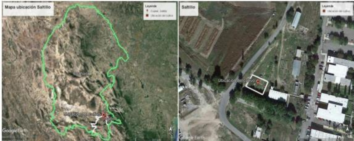
Figura 1.- Mapa de localización del experimento, (Universidad Autónoma Agraria Antonio Narro)

El presente trabajo experimental se realizó durante el ciclo primavera - verano del 2021, bajo condiciones de riego en la parcela perteneciente al Departamento de Ciencias del Suelo localizado en la Universidad Autónoma Agraria Antonio Narro (UAAAN), ubicada en Buenavista, Saltillo, Coahuila. Con coordenadas geográficas siguientes: 25^{\circ} 21' 13'' de latitud norte y 101^{\circ} 2' 5'' longitud oeste y una altitud de 1783 msnm.