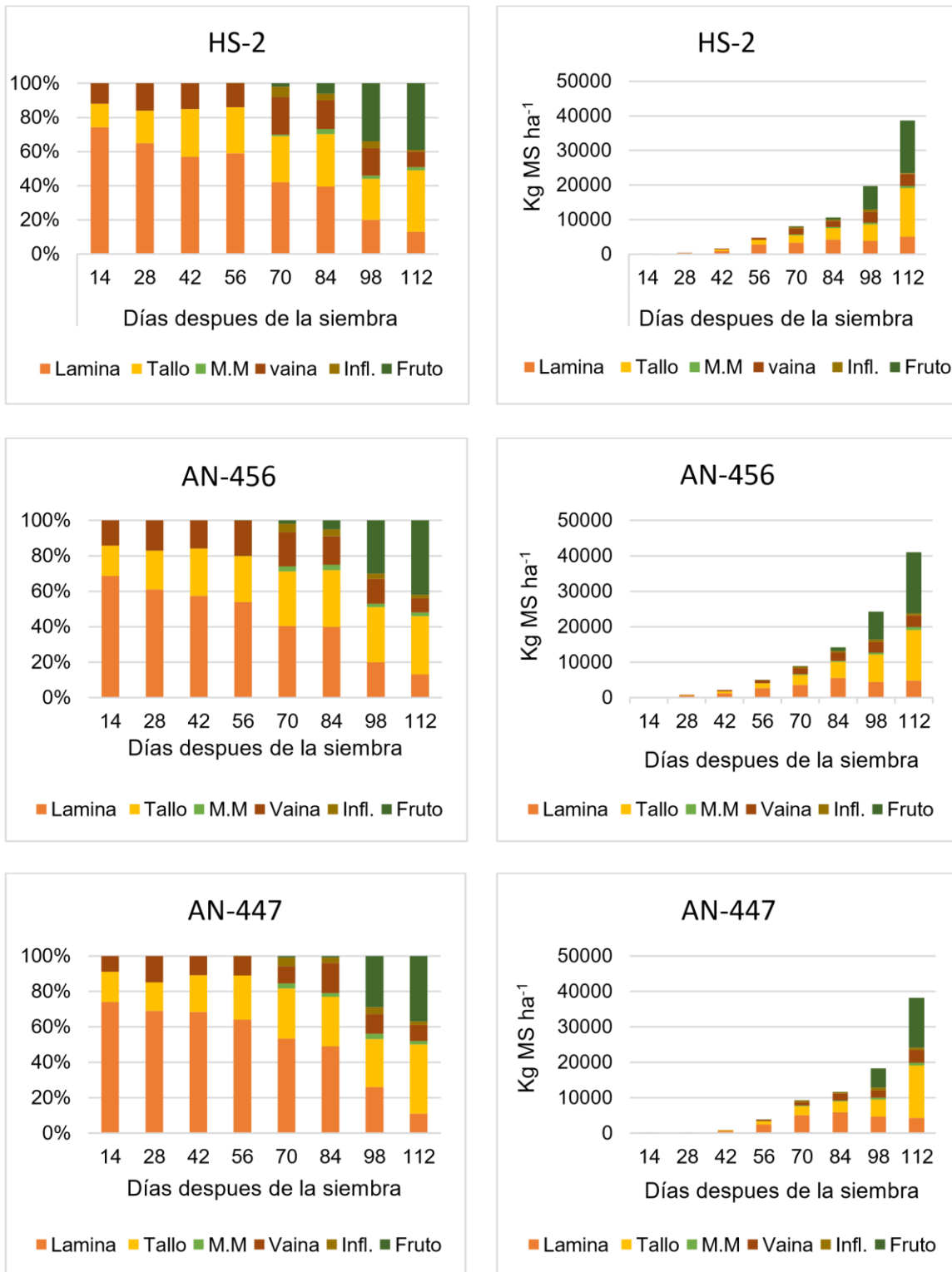
Figura 2. Cambios en la composición morfológica del cultivo del maíz de los híbridos HS-2, AN-456 y AN-447, cosechado a diferentes edades de la planta en el ciclo