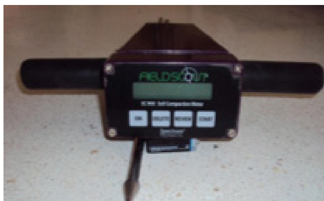
Figura 1. Penetrómetro digital sónico FIELDS-COUT SC 900.

En la Figura 2 se muestra gráficamente el comportamiento de la resistencia a la penetración ejercida en cada sistema de labranza.